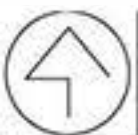
Схема планировочной организации земельного участка М 1:1000

К существующей опоре ЛЭП согласно технических условий